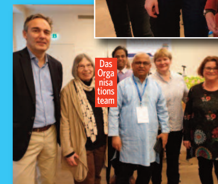
Das Orga- nisa- tions- team